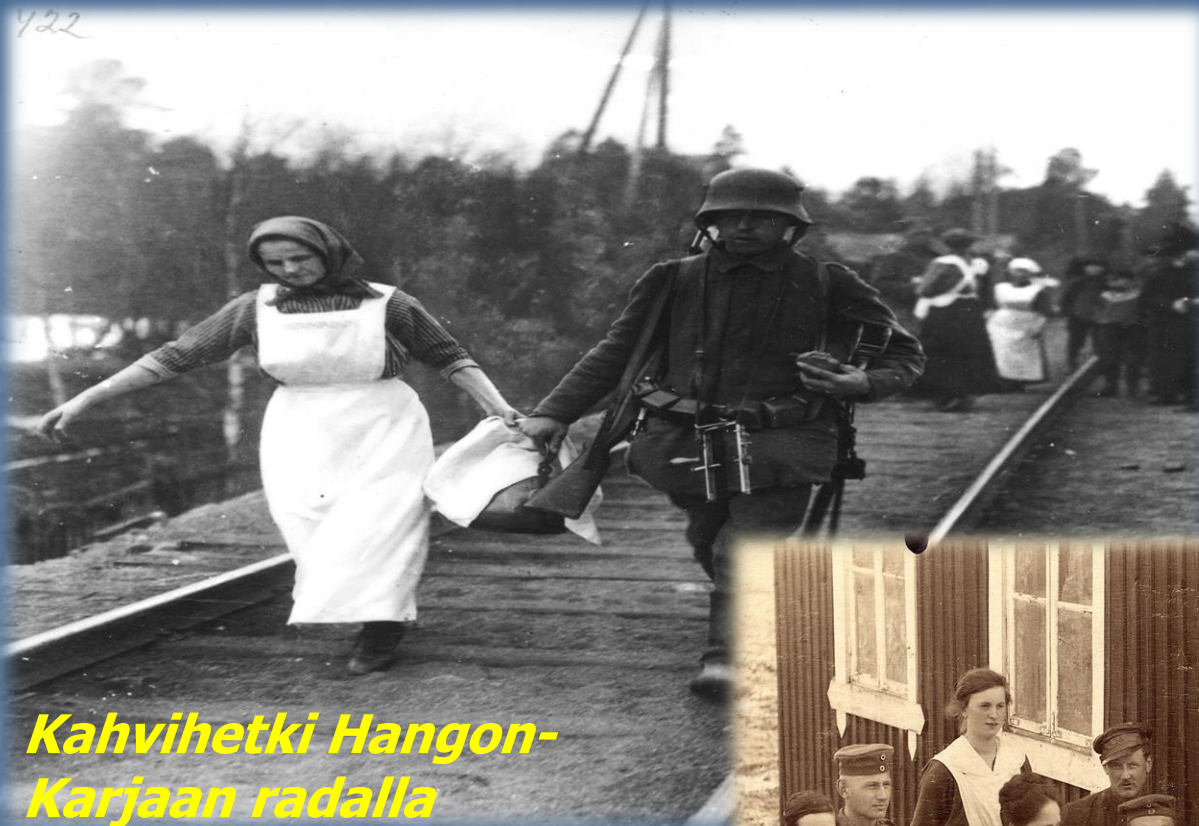
Kahvihetki Hangon- Karjaan radalla