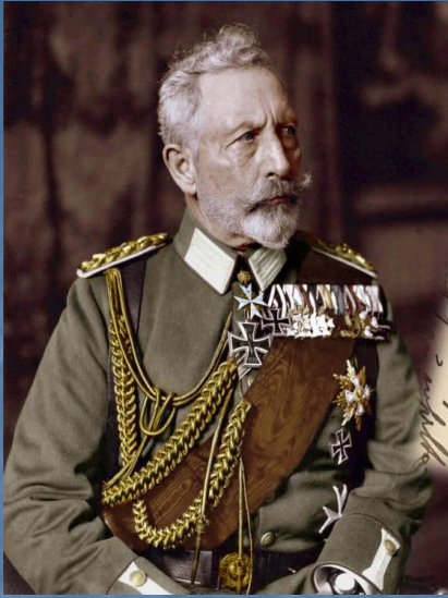
Kaiser Wilhelm II