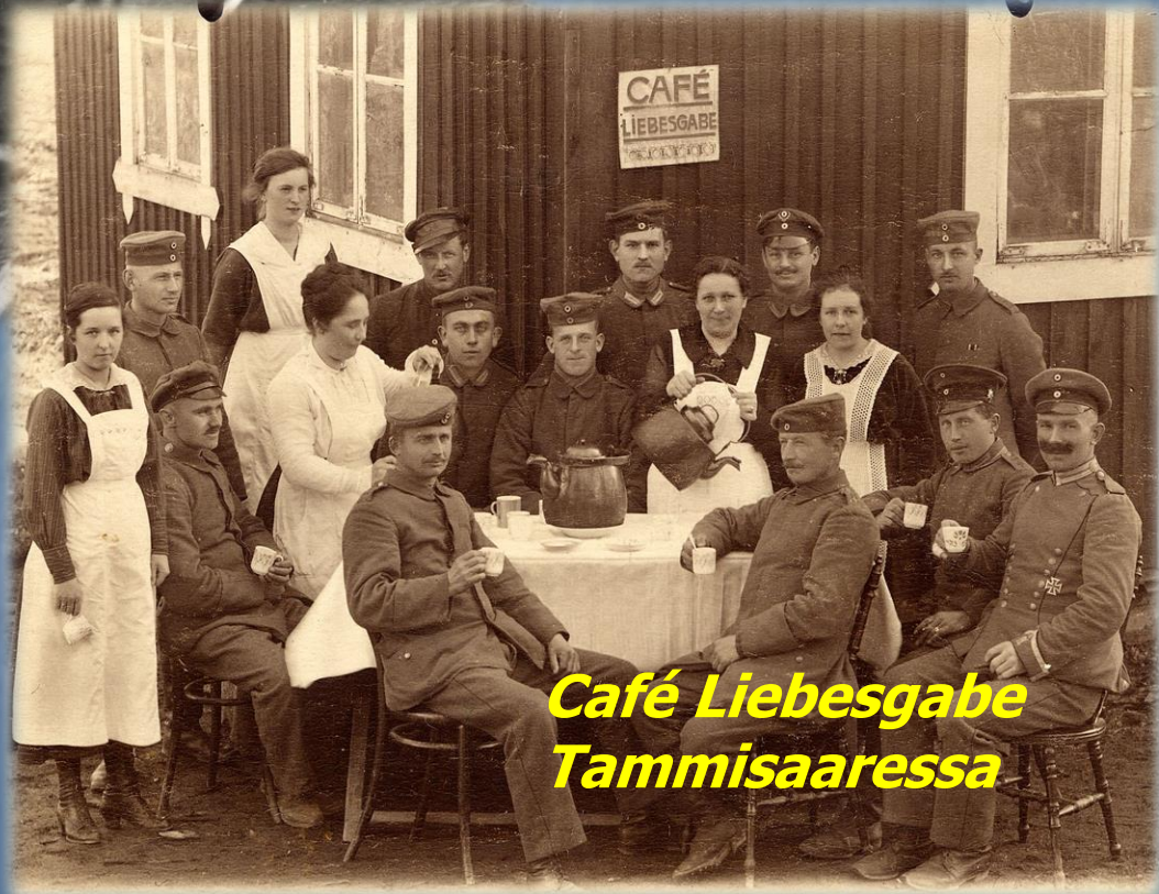
Café Liebesgabe Tammisaarella