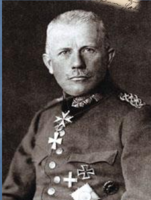
von der Goltz